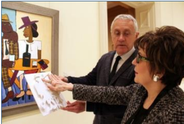
Museum audio description