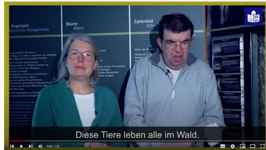
Video in Leichte Sprache